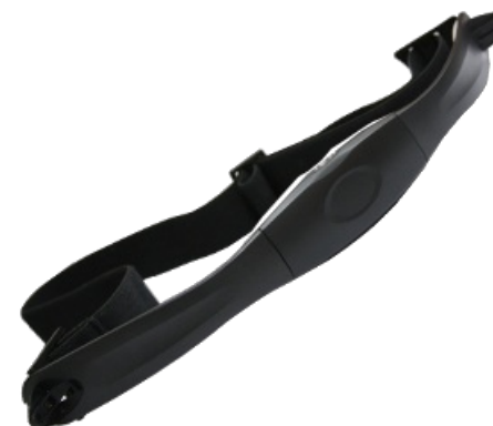
Беспроводной передатчик пульса входит в комплект