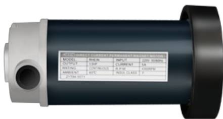
Надежный двигатель американской компании Leeson