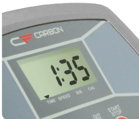
Легкочитаемый черно-белый LCD дисплей