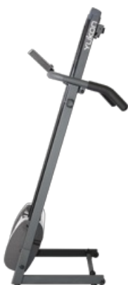
В сложенном виде