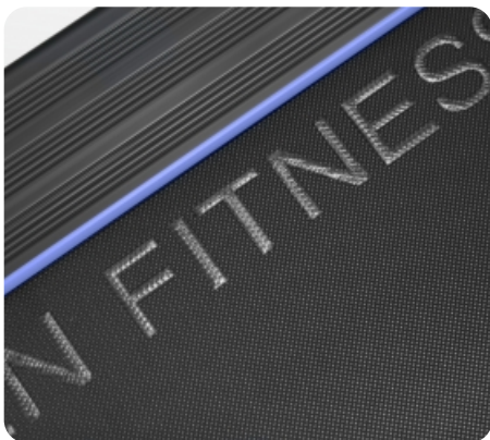
Многослойное полотно Habasit NVT-220 (толщина 2.0 мм)