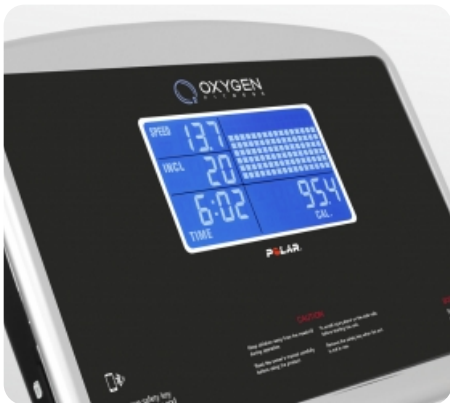
7 дюймовый (17,5 см) голубой многофункциональный LCD дисплей