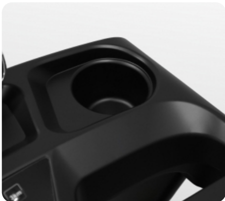
Подставка под бутылочку с водой