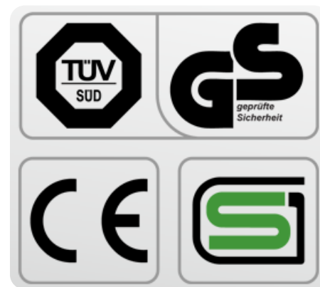
Обязательные сертификаты: европейский CE, немецкий GS TÜV, японский SG