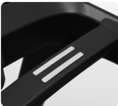
Сенсорные датчики пульса