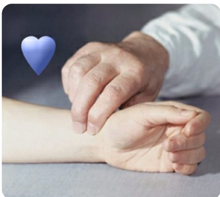
3 пульсозависимые программы