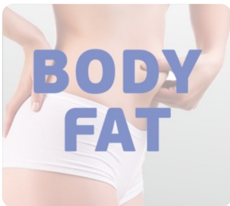
Режим жиранализатора Body Fat для определения комплекции организма