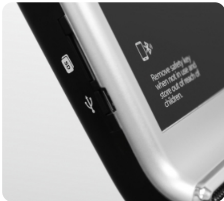
Воспроизведение аудио при помощи AUX IN, AUX OUT, USB и SD-Card