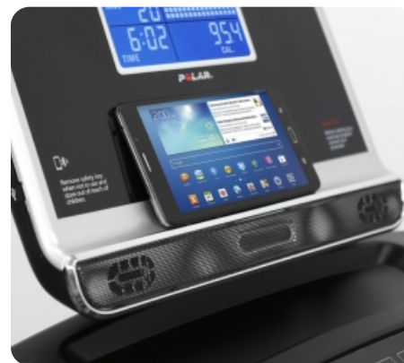
Подставка для гаджетов