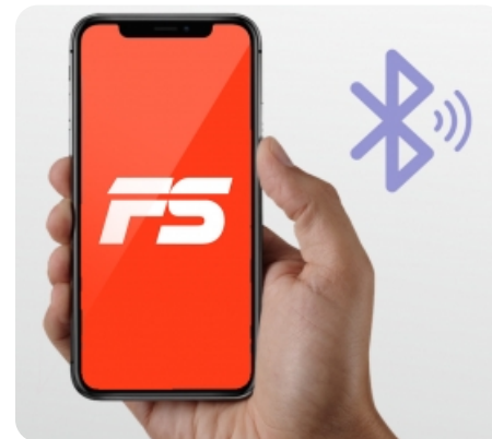
Синхронизация оборудования с мобильным приложением FitShow