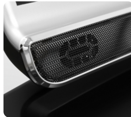
Встроенные динамики мощностью 5 Ватт