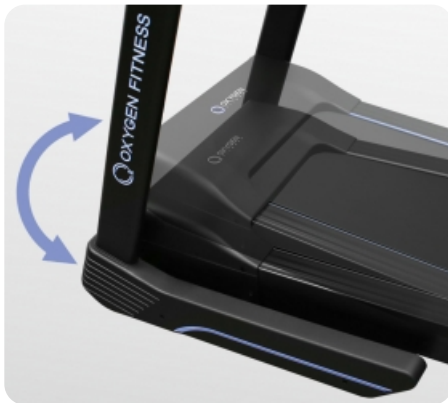
Электрически изменяемый угол наклона от 0 до 20%