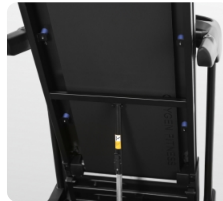
Великолепная амортизация: 4 плоских силиконовых эластомера (Natural S™) + 4 полноразмерных динамических эластомера (VCS™) + 1 поролоновая подушка