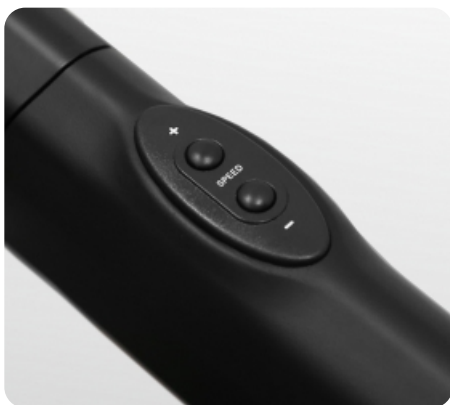
Дополнительные кнопки переключения наклона и скорости