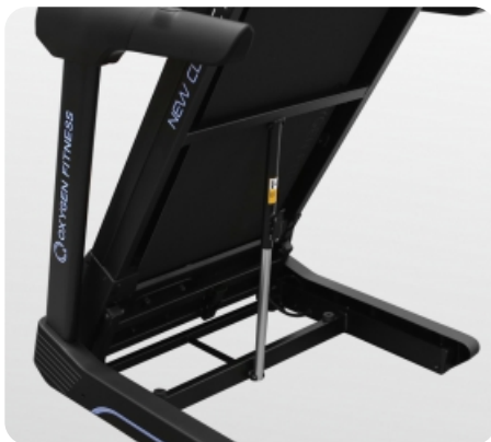
Легкое складывание за счет двухфазной гидравлики easyFOLD™