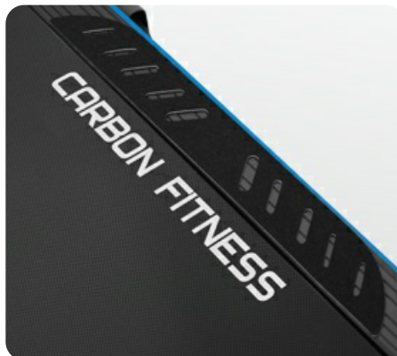
Антискользящие накладки для ног на боковых направляющих