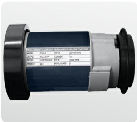
Надежный двигатель американской компании Leesop мощностью 2.5 л.с.