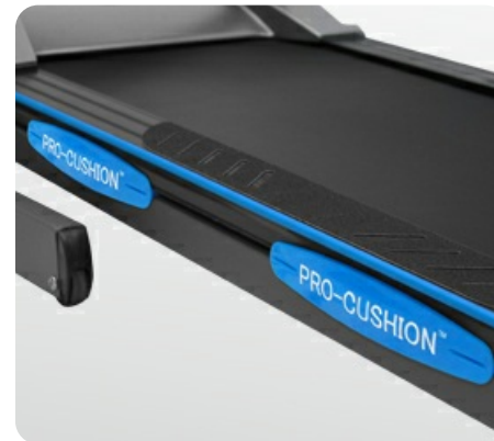
4 суперподушки Pro-Cushion™ для бережного отношения к суставам