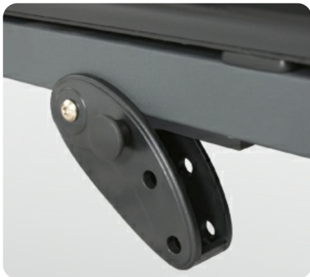
3 уровня механической регулировки угла наклона