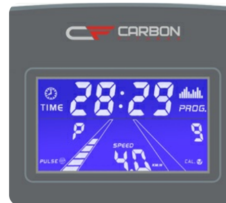
Голубой многофункциональный LCD дисплей с диагональю 4.9 дюйма (12.5 см.)