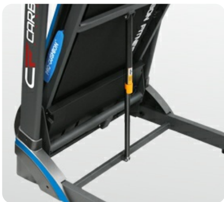
Двухфазная гидравлика Easy Drop™