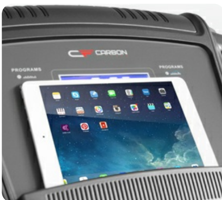
Подставка под планшет