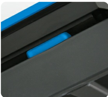
Дополнительные стабилизирующие эластомерные блоки Guard-Rail™