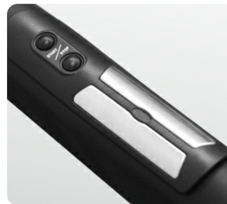
Рукоятки с сенсорными датчиками и "быстрыми" кнопками